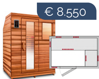
HM-LSE-3 BT met schuin dak